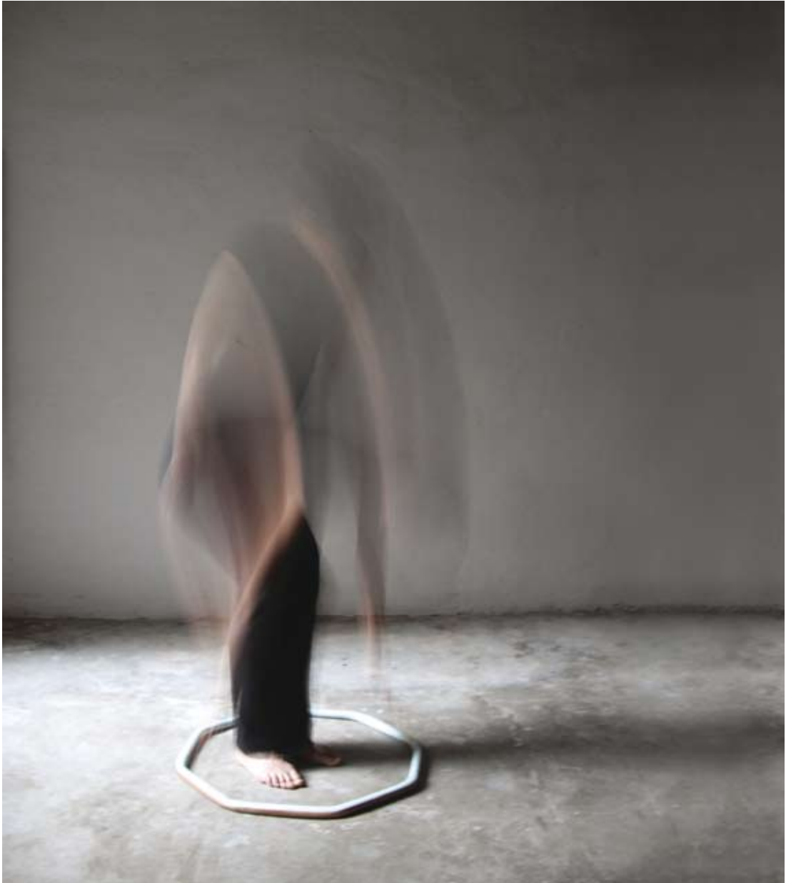
Acció amb anell blau nº1 2009 Impressió digital 19 x 19 cm.